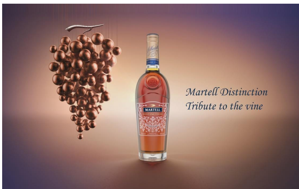
Reveal product - Martell