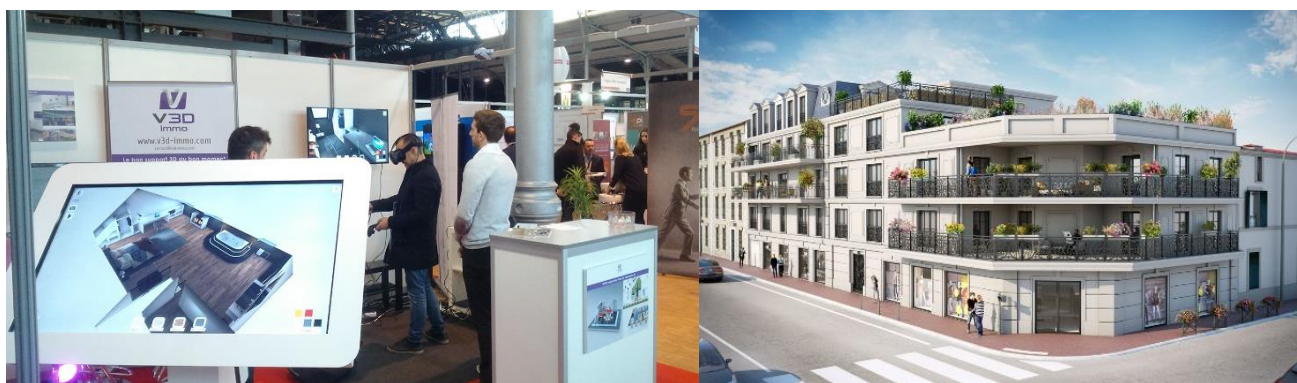
Maquette virtuelle 3D interactive - Table tactile

V3D Immo, le pôle dédié au secteur de l'immobilier révèle son concept inédit de visite virtuelle interactive pour l'immobilier dès la création de VISIMMO 3D en 2007. Les promoteurs immobiliers et constructeurs peuvent s'appuyer sur ces supports marketing en 3D pour accélérer leur processus de vente ainsi que pour rassurer et convaincre leurs prospects. En effet, grâce aux outils proposés par V3D Immo les futurs acquéreurs ont la possibilité de visiter des biens immobiliers qui n'existent encore qu'à l'état de plans. Ils peuvent se déplacer dans les espaces, simuler leurs aménagements ou encore choisir des revêtements.