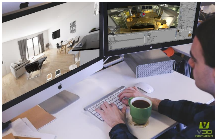
Formation à Unity 3D - V3D Formation

Les formations sont encadrées par des professionnels en exercice qui dédient une partie de leur temps à la transmission de leurs compétences. Ils sont issus des domaines de l'ingénierie informatique, de la 3D, du jeu vidéo, de l'architecture et des effets spéciaux. Ces formateurs s'appuient sur des cas concrets et forment d'une manière très pratique aux logiciels 3D et à GPGPU. Les formations sont vidéo-projetées en FULL-HD, chaque stagiaire dispose d'une station de travail double-écran, haute performance et repart avec un livret de formation.