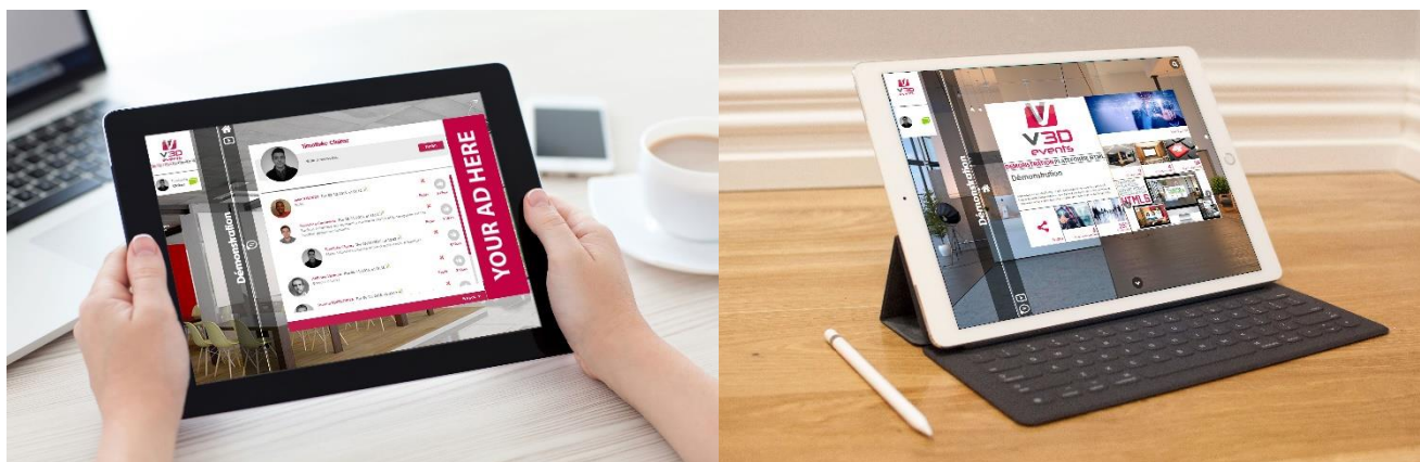
Plateforme d'événements virtuels – V3D Events

V3D Events est reconnu par plusieurs audits clients comme le premier opérateur de salons et d'événements virtuels 3D interactifs en France. Ce pôle continue à bénéficier d'investissements en R&D afin d'intégrer les technologies les plus innovantes et de réaliser des événements online toujours plus riches. En 2016, V3D Events lance notamment une nouvelle version de la plateforme en HTML5. Elle est désormais plus puissante, plus rapide et compatible avec tablettes et smartphones.