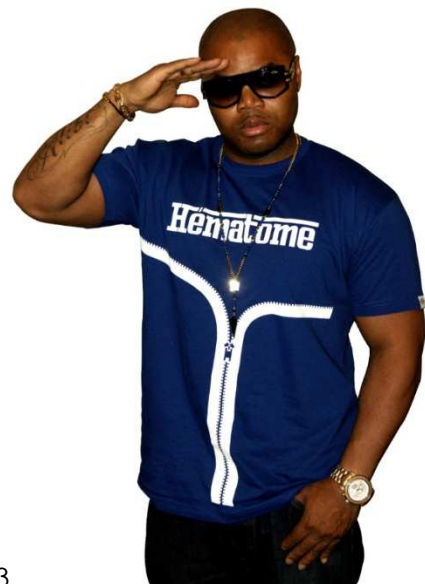
Alibi MONTANTA – Tournée 2013