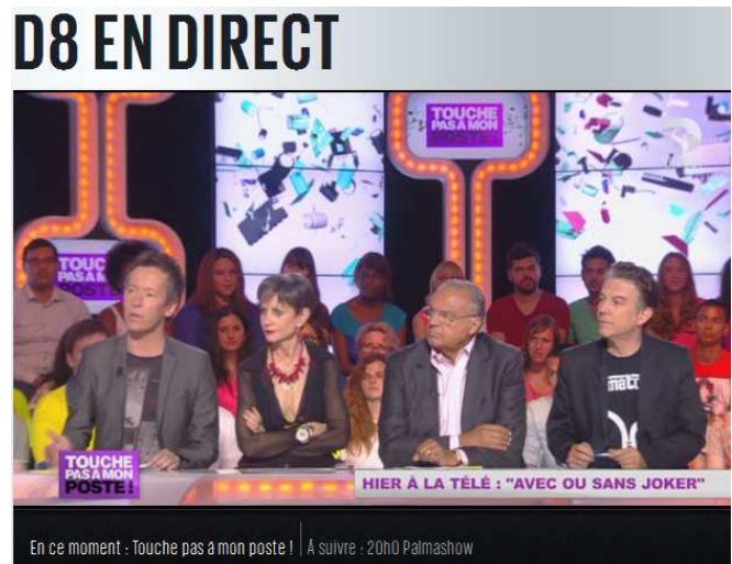
Philippe VANDEL – Touche pas à mon poste – Direct 8