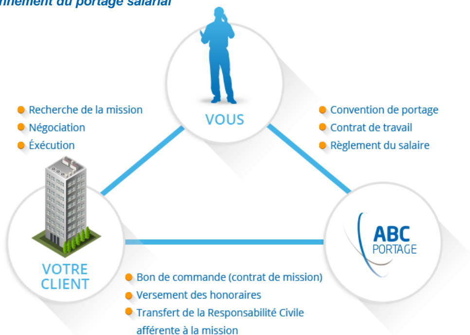
Schéma du fonctionnement du portage salarial

Le porté bénéficie du statut de salarié et par conséquent de tous les avantages qui lui sont liés : retraite, maladie, prévoyance, vieillesse, chômage, formation, etc., en comparaison à d'autres statuts qui n'apportent pas cette sécurité et autant de prestations sociales.