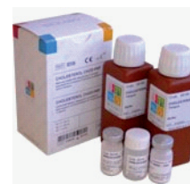
Kit de Réactifs avec un packaging soigné.