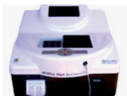
Appareils d'analyses en complément de gamme