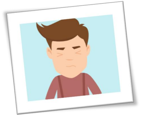
Un constat alarmant